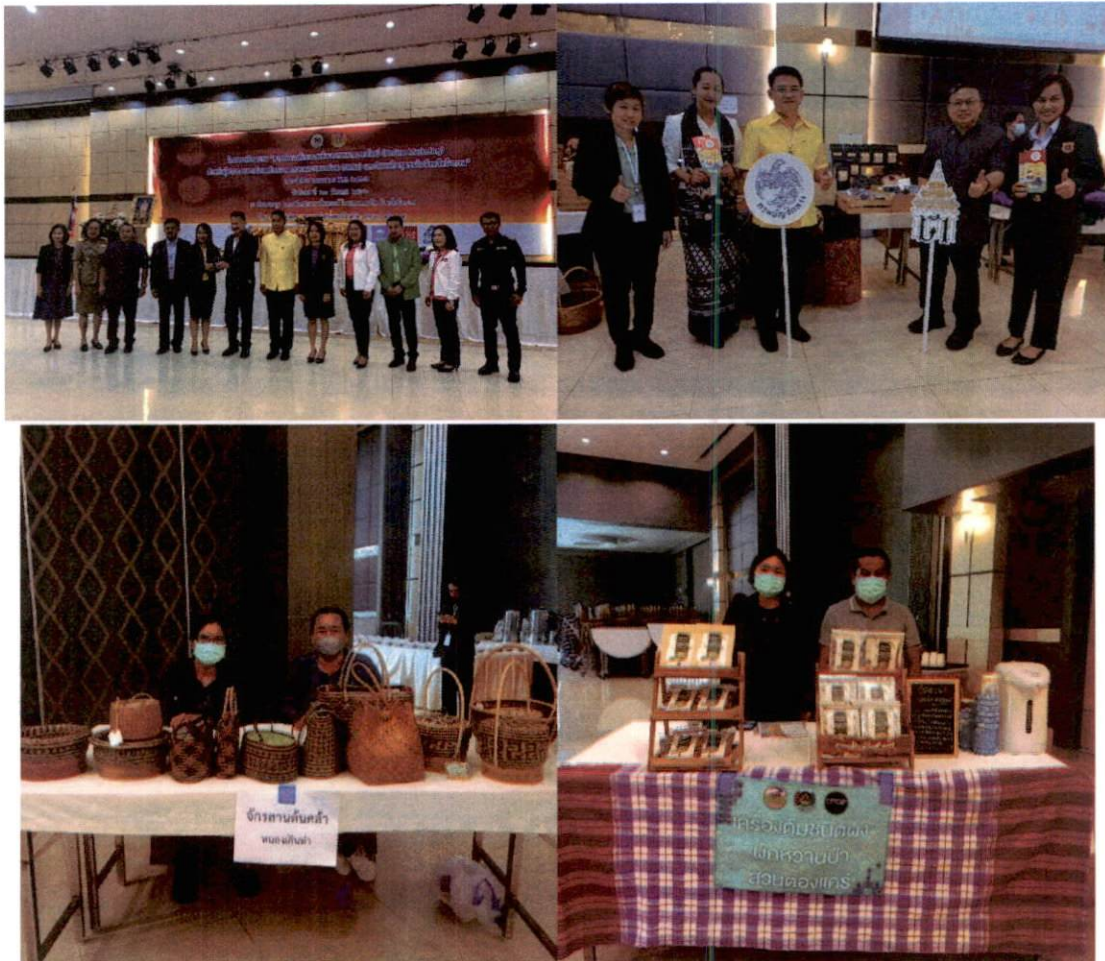
พิธีการศุลกากรส่งออกทางบก

“สร้างความเข้าใจในกระบวนการส่งออกแก่ผู้ประกอบการและกลุ่มผู้ผลิตสินค้า OTOP”